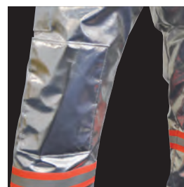
キルティング内蔵 膝パット