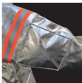
キルティング内蔵 肘パット