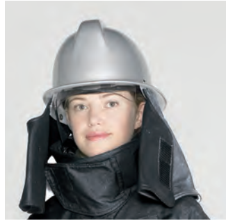
NE-3030 ●シールド及びシコロ付きヘルメット 防火帽 (ブラック、オレンジ、ネイビー)