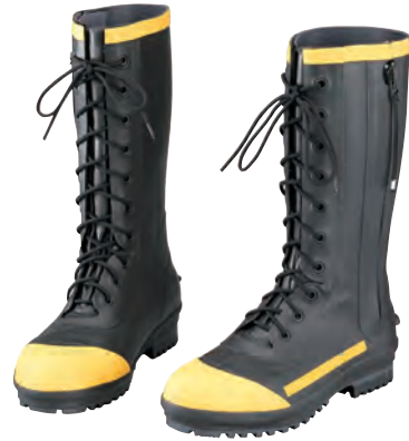
NE-3043 耐摩耗性の優れた特殊合成繊維裏布使用。シューレースとジッパーのダブル機能。踏み抜き防止鋼板入り。高突刺抵抗材(ケブラー)入り。 防火靴(長)